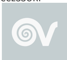
HOMEMATIC IP SMART PLUG Codice 21379