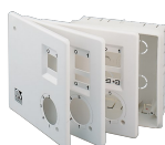
KIT SCB5 (TRASF.5 V.) Codice 22483