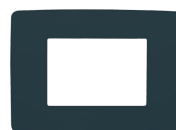
PSC-B Codice 22463