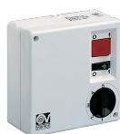
SCNRL5 UNIF. X NK SOFFITTO Codice 12957