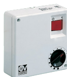
C 2.5 (COMANDO EL. 2.5 A)