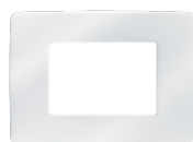
PSC-W Codice 22462