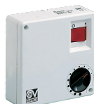
SCNR/M SCAT.COM. NON REV. MULT. Codice 12982