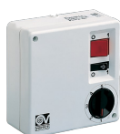
SCNRL5 UNIF. X NK SOFFITTO Codice 12957