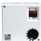
SCNR5 UNIF.X NK SOFFITTO Codice 12955