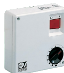
C 2.5 (COMANDO ELETTRICO)