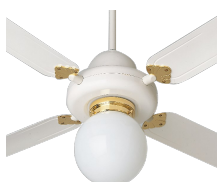
DECOR LIGHT KIT (KIT LUCE) Codice 22416