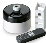
TELENORDIK 5T Codice 22387