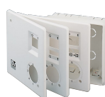
KIT SCB5 (TRASF.5 V.) Codice 22483