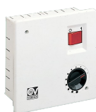
SCNRB SCAT.COM.NON REV.INCASSO Codice 12971