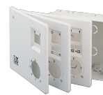
KIT SCB (TRASF.E.C.) Codice 22481