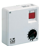
C 1.5 (COMANDO EL. 1.5 A) Codice 12966