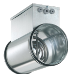
ELECTRIC HEATER 500 Codice 21630