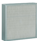
FTR F7 228X224X24 Codice 22625