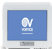
CB TOUCH LCD W Codice 21933