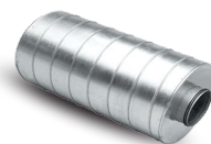
NA 160 PHI Codice 21643