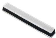
FTR EPM1 55% (F7) 418X44X21 Codice 21626