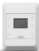
CB LCD D Codice 21381